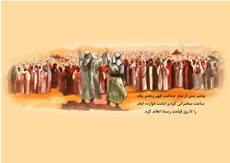
پیامبر پس از نماز جماعت ظهر و عصر یک ساعت سخنرانی کرد و امامت دوازده امام را تا روز قیامت رسماً اعلام کرد.