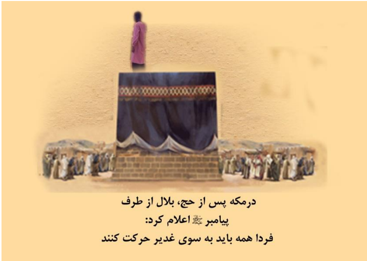
درمکه پس از حج، بلال از طرف پیامبر ﷺ اعلام کرد: فردا همه باید به سوی غدیر حرکت کنند